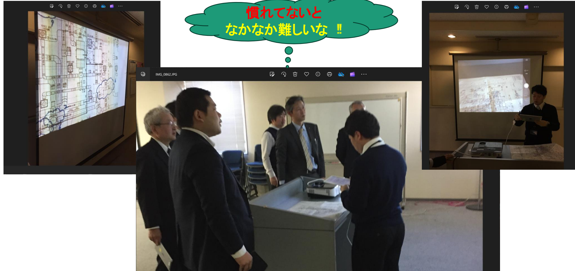
Zoom ブレイクアウトルーム機能による講習会 (トライアル風景)